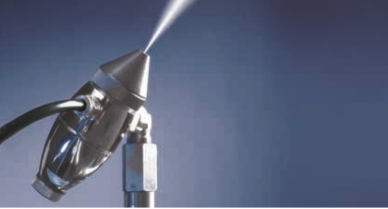
JetSpray basınçlı hava ve su ile nemlendirme

TESİSİNİZ İÇİN ÜCRETSİZ DANIŞMANLIK İSTEYİN