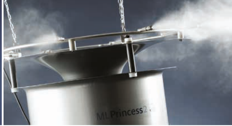
ML Princess yüksek basınçlı nemlendirici