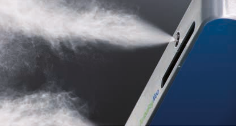
Draabe TurboFogNeo yüksek basınçlı nemlendirici